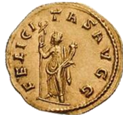
Valerian, profil, pe un aureus dedicat zeiței Fortuna

Valerian a inițiat în anul 258 o mare prigoană împotriva creștinilor. Printre victime s-au numărat Papa Sixt al II-lea, episcopul Laurențiu de Roma și Fructuosus, episcopul din Tarragona. Tot în această perioadă a murit Ciprian, episcop în Cartagina. În Utica, 300 de creștini care au refuzat să aducă jertfe lui Jupiter au fost aruncați într-o groapă de var aprins. Valerian a publicat primul său edict de prigonire a creștinilor. Prin edict, creștinii erau obligați la cultul național al zeilor păgâni și le erau interzise adunările în cimitire, contravenienții fiind pasibili cu exilul sau cu pedeapsa capitală.